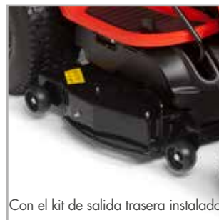
Con el kit de salida trasera instalado