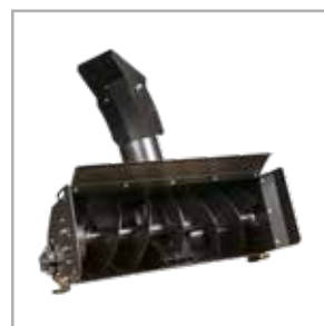
Lanzador de nieve 100 cm (SYC)