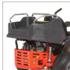
Soporte de carga