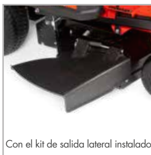
Con el kit de salida lateral instalado