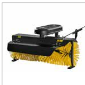
Cepillo barredor 120 cm (SYC)