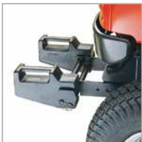
Contrapesos delanteros y traseros