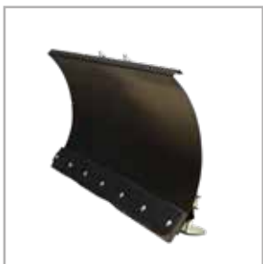
Pala quitanieves 120 cm (SLC & SYC)