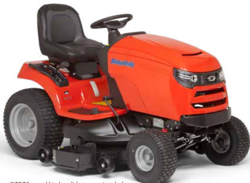
SLT275 con el kit de salida trasera instalado.