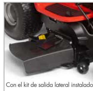
Con el kit de salida lateral instalado