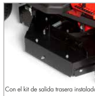
Con el kit de salida trasera instalado